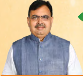
श्री नरेन्द्र मोदी माननीय प्रधानमंत्री