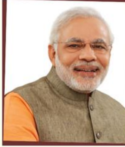
श्री नरेन्द्र मोदी माननीय प्रधानमंत्री, भारत